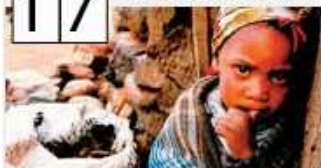
Día Internacional de la erradicación de la pobreza