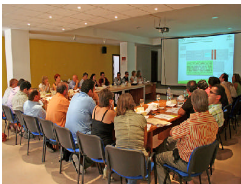
Amplia afluencia de agentes sociales, políticos y económicos a la mesa primera mesa comarcal del Altiplano de Granada

Los Grupos de Desarrollo Rural de la provincia de Granada ya cuentan con numerosas conclusiones sectoriales que ahora se analizan desde una perspectiva territorial