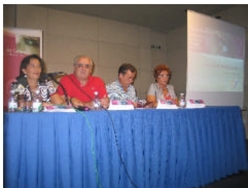
En la imagen, inauguración del encuentro PROGRESA celebrado en Écija

Las necesidades de jóvenes y mujeres han sido cuestiones transversales en el diagnóstico de muchas comarcas andaluzas. Así, el Grupo de Desarrollo Rural de la Campiña y los Alcores de Sevilla, presentó en el marco de los encuentros PROGRESA (para género) y PROJOVEN (para juventud) que acogieron los municipios sevillanos de Écija y Mairena del Alcor los días, 6 y 7 de septiembre, respectivamente, dos estudios sobre la perspectiva de género y la juventud en la comarca. Entre los datos más relevantes que arrojan tales estudio destacan la alta tasa de desempleo de las mujeres de la comarca, muy superior a la de los hombres, y que se acentúa entre las mujeres mayores de 45 años; y el dato de que el 84 por ciento de las personas que fueron entrevistadas en el estudio coincide en que el fracaso escolar y las drogas son los principales problemas de la juventud, por delante de la escasa oferta de empleo, la inestabilidad laboral y la dificultad en el acceso a la vivienda.