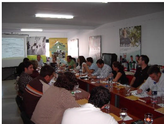
Mesa comarcal organizada por el GDR de Los Pedroches

Los Grupos de Desarrollo Rural de Córdoba continúan con la celebración de mesas comarcales