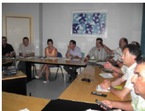
Mesa participativa organizada por el GDR de la Campiña de Jerez, GDR coordinador de la provincia de Cádiz

El GDR de Los Alcornocales ha aprovechado la experiencia acumulada con el software Impact Explorer , sistema que, como se ha comentado en otras ocasiones, permite extraer y sistematizar las opiniones de un gran número de personas agilizando así las dinámicas participativas. Pues bien, el GDR ha puesto este sistema a disposición (y, de hecho, ya se está utilizando) de un grupo de trabajo en el que participa el propio GDR creado para la implantación de la Carta Europea de Turismo Sostenible en el Parque Natural del Estrecho