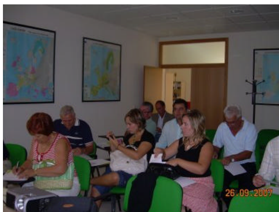
En la foto, participantes en la validación de la DAFO comarcal organizada por el GDR del Andévalo Occidental

Los GDR onubenses, habiendo recopilado suficiente información en las mesas de debate sectorial, tratan ahora de definir con la población un marco de actuación para cada una de las comarcas