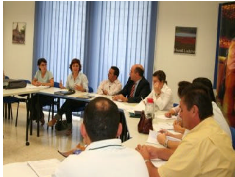
En la imagen, la segunda sesión de la mesa comarcal organizada por el GDR de Antequera

Ya en una segunda jornada de trabajo, el debate se orientó a los sectores de la ganadería, la agroindustria y el turismo. En esta ocasión, una de las conclusiones más importantes fue la necesidad de que el sector ganadero y la agroindustria se unan para promocionar conjuntamente los productos agroalimentarios. En cuanto al sector turístico, los asistentes a la mesa manifestaron la conveniencia de poner en marcha un Plan Turístico Comarcal que mejore la coordinación de todos los agentes implicados y que dé difusión a las posibilidades de turismo rural en la zona.