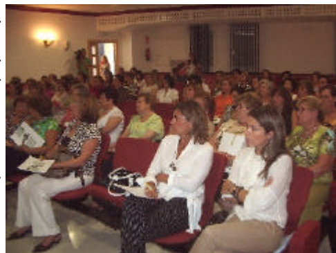
En la foto, la jornada sobre Género organizada por el GDR de la Subbética Cordobesa

renos se mantienen los localismos. A este respecto, se propuso seguir celebrando eventos de ámbito comarcal que potencien la unión de la población de la comarca.