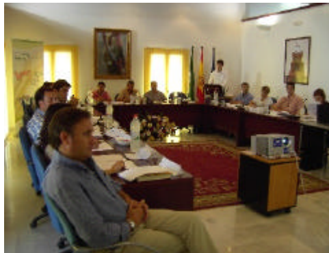
En la imagen, mesa temática sobre Economía organizada por el GDR de la Gran Vega de Sevilla

Por su parte, el Grupo de Desarrollo Rural de la Gran Vega de Sevilla analizaba la situación de los distintos sectores económicos y del entorno de la comarca en una segunda tanda de debates temáticos celebrados en el mes de septiembre. Y es que la interacción de ambos sectores es muy a tener en cuenta de cara a conseguir un desarrollo sostenible. Una apuesta por la expansión y fortalecimiento de otros sectores distintos al de la agricultura que contribuyan a diversificar su economía, el fortalecimiento de la cultura emprendedora, la utilización de la biomasa vegetal generada en la actividad agrícola como una fuente de energía renovable, la mejora en el tratamiento de los residuos sólidos, la concienciación a todos los niveles de la población de la importancia del reciclado, y la apuesta por la innovación y la calidad en la agricultura fueron algunos de los puntos de encuentro que se concluyeron en ambos debates.