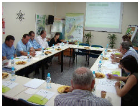
Representantes sectoriales debaten las líneas estratégicas que marcarán el rumbo de la comarca del Levante Almeriense

El Grupo de Desarrollo Rural del Levante Almeriense ha celebrado su primera mesa comarcal. En ella se recogieron interesantes sugerencias y aportaciones que enriquecerán la estrategia comarcal. Así, quedaron ya validadas las líneas fundamentales que guiarán la actuación del GDR en el próximo marco.