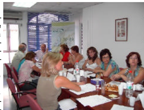
Agentes sociales de la Vega-Sierra Elvira debatiendo sobre las diversas variables del entorno que afectan a la comarca

En el territorio de la Vega-Sierra Elvira se debatía sobre la influencia que el entorno ejerce sobre la vida en la comarca. Y es que esta dependencia cobra algo más de importancia que para el resto de territorios debido a su cercanía a la capital y la proliferación de pueblos dormitorio en la zona. Por ello, en la mesa de Entorno celebrada en la sede del GDR de la Vega-Sierra Elvira se resaltó la importancia de que la población de la comarca esté informada de los acontecimientos externos al territorio y que influyen de manera directa en ella. Principalmente, preocupan cuestiones económicas, ya que éstas suponen el motor de desarrollo de la Vega-Sierra Elvira. Los altos tipos de interés y la inflación son temas que inquietan a la población; la subida de los precios y el estancamiento de los sueldos son elementos de gran influencia en la vida de las personas que residen en el territorio.