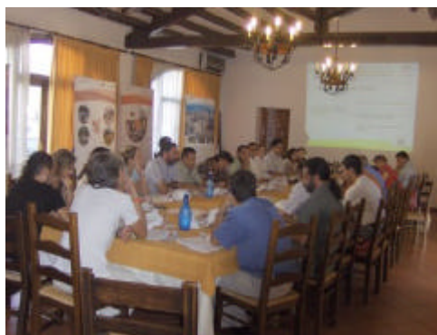
Tercer encuentro de la mesa comarcal promovido por el Grupo de Desarrollo Rural de la Sierra de Cádiz

Por último, el Grupo de Desarrollo Rural de la Sierra de Cádiz celebró la tercera sesión de su mesa comarcal el pasado 25 de septiembre. En este encuentro se establecieron las líneas prioritarias en las diferentes áreas temáticas analizadas por la población.