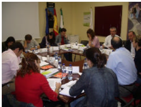
Agentes sociales definiendo los objetivos, líneas estratégicas y actuaciones de la estrategia comarcal de Sierra Mágina

la segunda mesa comarcal celebrada en el territorio de Sierra Mágina y consideradas prioritarias para desarrollarlas en la nueva estrategia de la comarca en el periodo 2007-2013.