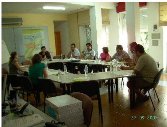
Tercera mesa comarcal celebrada en la comarca de Filabres-Alhamilla

Varios de los Grupos de Desarrollo Rural están inmersos en la celebración de la mesas comarcales a la vez que otros ya han finalizado esta etapa