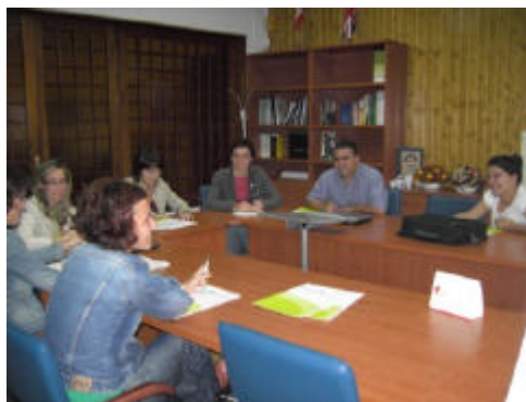
Representantes del mundo rural en la mesa comarcal del GDR de la Cuenca Minera de Riotinto

En el territorio de la Costa Occidental de Huelva, la sede de la Oficina Comarcal Agraria (OCA Costa), acogió el pasado 3 de octubre una mesa comarcal que arrojó interesantes conclusiones. Por ejemplo, se constató la relevancia que tiene el medio natural de la costa que, además, ofrece numerosos recursos naturales que deberán identificarse y llevarse a cabo actuaciones para su conservación y puesta en valor de modo sostenible. También se consideró como fortalezas los servicios básicos ofertados en la costa, que son de gran calidad, al igual que las infraestructuras dedicadas al ocio. Con respecto a la actividad económica, el territorio cuenta con un mercado turístico emergente que puede potenciarse mediante una oferta complementaria al sol y la playa, a través de la creación de empresas de turismo activo y rural y formando a las personas para que se dediquen a este sector. En cuanto a la agricultura y la pesca se manifestó la necesidad de fomentar la comercialización de los productos por parte de los propios empresarios, al tiempo que se ve juzgó imprescindible capacitar profe-