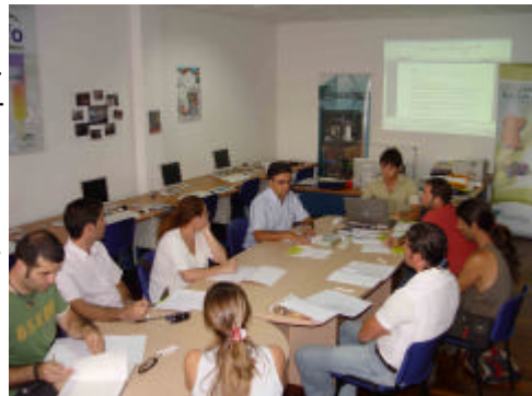
Participantes en la mesa comarcal organizada por el GDR de la Sierra de las Nieves en un momento del debate

las que cuenta la comarca; la débil explotación turística del patrimonio etnográfico-cultural; la insuficiente diversificación y consolidación de la actividad agroindustrial o el escaso aprovechamiento de la demanda de productos ecológicos y con elevado valor añadido.