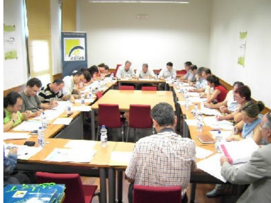
En la imagen, debate sobre Población y Sociedad organizado por el GDR de la Loma y Las Villas

Grupos de Desarrollo Rural y agentes sociales validan los objetivos y las líneas de actuación que quedarán recogidos en las estrategias de desarrollo de los territorios jiennenses