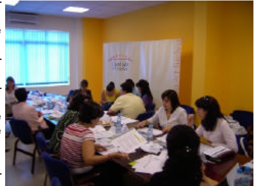
Agentes clave del territorio y técnicos del GDR del Condado de Huelva trabajan en la mesa temática sobre Población y Sociedad