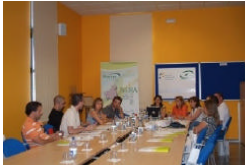
En la foto, la mesa temática sobre Población y Sociedad del GDR del Guadalteba

Por su parte, los expertos en otras industrias del territorio, resaltaron como necesi-