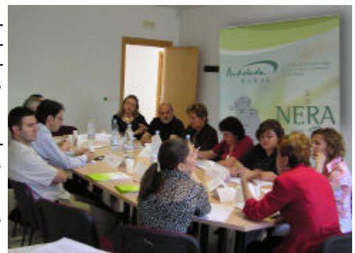
En la imagen, transcurso de la mesa temática sobre Turismo organizada por el GDR de Antequera

Los expertos reunidos en torno a la mesa de Agricultura y Ganadería, celebrada el 14 de Junio en Villanueva de Algaidas y organizada por el mismo GDR, aseguraron que la introducción de nuevas especies bioenergéticas, la tecnificación de las producciones y organización de cursos de formación especializados, favorecerán a la comercialización y diversificación de la producción.