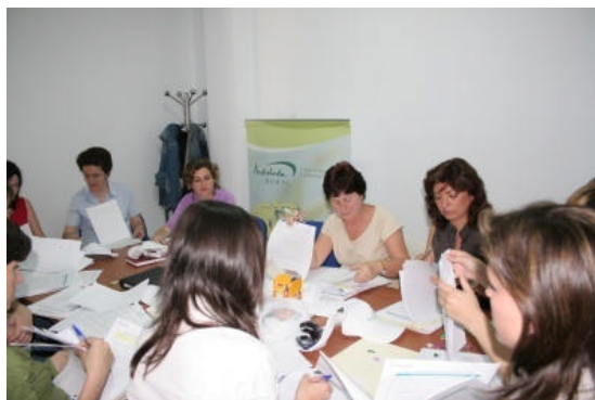
Imagen de la mesa de Género en la comarca del Corredor de la Plata en que se presentó el Proyecto NERA

Para ello han organizado mesas temáticas que fomentarán el debate técnico para lograr un consenso y detectar Fortalezas, Debilidades, Amenazas y Oportunidades del territorio