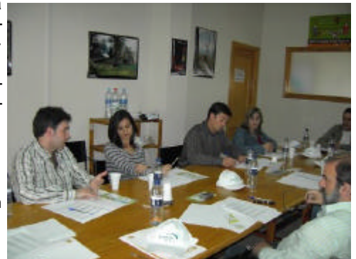
Imagen de la mesa de Infraestructuras y Transportes convocada por el GDR de la Sierra de Segura

En cuanto a las infraestructuras y los transportes, se constató, por una lado, la necesidad de adecuar las plazas escolares al número de alumnos en la comarca, así como de un mayor número de especialistas en determinados centros y un mejor reparto de recursos de que disponen; y por otro, la necesidad de fomentar el transporte público, proponiendo el tren como una alternativa viable. Se debatió, asimismo, sobre las carreteras y, aunque se apuntó una gran mejora en los últimos años, se propuso incidir, fundamentalmente, en la señalización de las relacionadas con lugares turísticos. Las conclusiones más destacadas de la mesa sobre Población y Sociedad fueron el hecho de que la población está muy arraigada al territorio, pues conserva sus tradiciones y costumbres, así como sus oficios artesanales y tradicionales. Se constató también que existe una limitada programación deportiva y cultural que se adaptarse a las necesidades de los municipios y de sus habitantes.