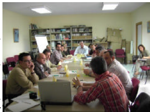
En la imagen, participantes en una de las mesas temáticas lideradas por el GDR del Medio Guadalquivir

participación de representantes de diversas entidades vinculadas al desarrollo del territorio. Así, se darán encuentro representantes de ayuntamientos, asociaciones de desarrollo local, sindicatos, empresas y asociaciones cívicas.