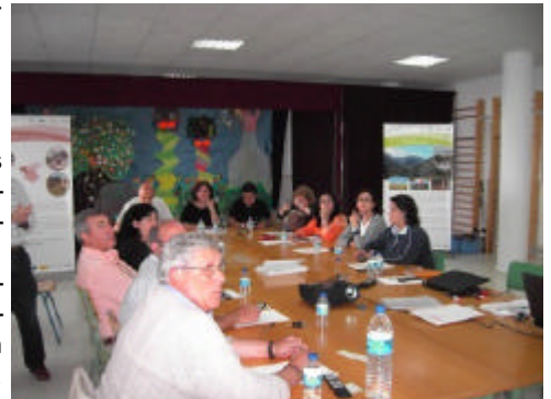
En la foto, la mesa temática sobre Población y Sociedad organizada por el GDR de la Campiña de Jerez

De la mesa sobre Población y Sociedad se obtuvieron importantes conclusiones como la que se refiere a la existencia de dos tipos de núcleos de población en el territorio, pedanías y barriadas rurales, que presentan diferentes grados de dependencia respecto a la ciudad generando, según los participantes en la mesa, cierta rivalidad en ellos y minando el sentimiento comarcal.