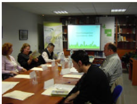
En la imagen, una de las seis mesas temáticas organizadas por el GDR del Poniente Granadino

representantes de los municipios de la zona están analizando desde aspectos demográficos a las infraestructuras, pasando por los servicios y los principales sectores de actividad de los municipios que forman parte del ámbito de intervención del Grupo de Desarrollo Rural del Poniente Granadino. De manera transversal, en todas las mesas temáticas se están teniendo en cuenta las cuestiones medioambientales y de igualdad de género.