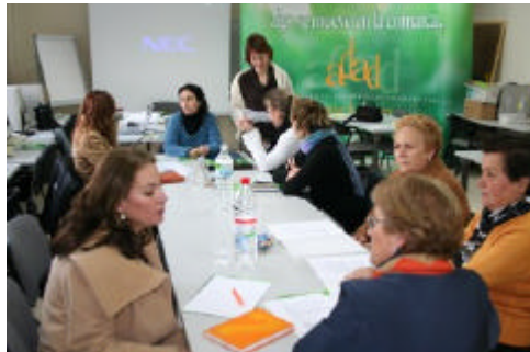
En la mesa de Turismo, de la comarca del Aljarafe-Doñana se analizaron las dificultades que frenan el desarrollo turístico

En el foro centrado en la Participación y Población se subrayó la escasa cultura y