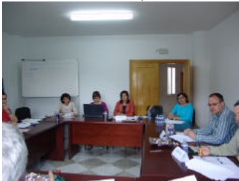
Mesa sobre Territorio y Medio Ambiente organizada por el GDR de Los Vélez

La segunda de las mesas celebradas en la comarca versó sobre Territorio y Medio Ambiente y sirvió para poner de manifiesto la problemática ambiental de la zona. Los expertos concluyeron que es necesario un mayor control por parte de las Administraciones en diversos temas, como el de las construcciones ilegales de casas, cortijos, pozos de agua y pozos ciegos. También se destacó como un problema que afecta gravemente a los suelos y aguas superficiales de la comarca los vertidos residuales de la agricultura y ganadería intensivas, especialmente los vertidos de purines.