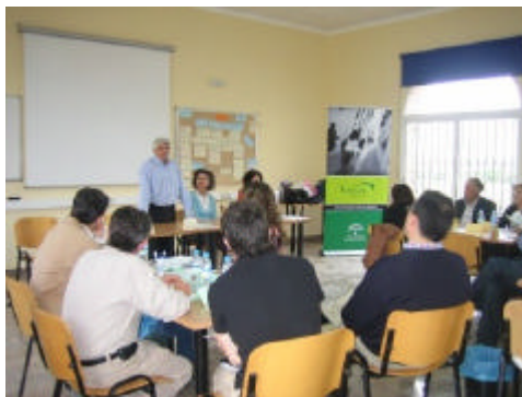
A la mesa del GDR del Almanzora estaban invitados los organismos y entidades que realizan tareas de desarrollo local en la comarca

Por otra parte, el GDR del Almanzora celebró en el mes de Abril, en su sede de Cantoria, la primera reunión del Comité Impulsor de la comarca. Se trata de un grupo de personas implicadas en el desarrollo económico y social del Valle del Almanzora que ayudará, con sus aportaciones, al GDR en el proceso de elaboración del plan estratégico comarcal. Las reuniones de este comité se repetirán al menos una vez al mes, hasta que finalice el proceso de elaboración de la estrategia de desarrollo comarcal.