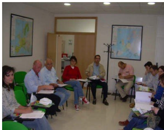
En la foto, la mesa de Territorio y Medio Ambiente organizada por el GDR del Andévalo Occidental

Este proceso participativo forma parte de la Nueva Estrategia Rural para Andalucía que dará lugar a un diagnóstico del mundo rural andaluz