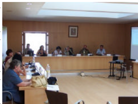
Mesa de Medio Ambiente, Infraestructuras y Transportes de la comarca de la Alpujarra-Sierra-Nevada

El Grupo de Desarrollo Rural de la Alpujarra-Sierra Nevada organizó, en la parte granadina de su ámbito de intervención, una mesa temática que versó sobre la situación del medio ambiente, las infraestructuras y los transportes en la comarca. Tuvo lugar el 12 de Junio en Órgiva y a ella asistieron agentes de desarrollo local, técnicos de medio ambiente, representantes de los ayuntamientos, empresarios, representantes de asociaciones, así como el conservador de los Espacios Protegidos de Sierra Nevada. El debate que más interés suscitó fue el surgido a partir de la variable que trata de medir la disponibilidad y calidad de los recursos hídricos. Se constató que tal disponibilidad de este recurso es variable, pues hay zonas que cuentan con agua en abundancia y otras en las que escasea. Además, se estableció la necesidad de conservación del paisaje alpujarreño como bien cultural, ambiental y turístico, la necesidad de mejorar una red de transporte público intercomarcal y la ineludible mejora de los servicios básicos que permitan a los pobladores de la comarca acceder a ellos minimizando sus desplazamientos. ( Volver )