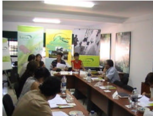
Mesa temática sobre Infraestructura y Transporte organizada por el GDR de Los Pedroches

Estas mesas han contado con la participación de agentes sociales, económicos y políticos conocedores de la realidad de los territorios