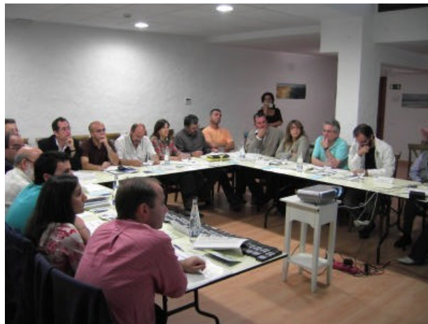
La mesa sectorial sobre Territorio y Medio Ambiente celebrada en la comarca del Litoral de la Janda contó con un gran número de participantes

Como novedad, los GDR de la provincia de Cádiz han utilizado en este proceso el software Impact Explorer, una valiosa herramienta tecnológica que ha servido para dinamizar las mesas temáticas. Este sistema se ha probado muy útil en el desarrollo de las mesas, pues cada participante pudo votar de forma anónima, con lo que se acortó la duración de los encuentros y permitió a los GDR gaditanos sistematizar más fácilmente las ideas más importantes que se utilizarán para elaborar las matrices DAFO finales. El siguiente eslabón del Proyecto NERA pasa por las mesas comarcales, a los que se llevarán las conclusiones más significativas que se han recabado en las diferentes mesas sectoriales. ( Volver )