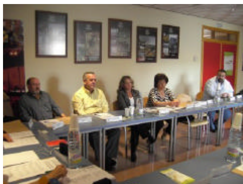
Mesa temática celebrada en la sede del GDR del Condado de Jaén, en Santisteban del Puerto

biental de esta comarca, al definir los principales problemas y retos medioambientales a los que se enfrenta el territorio del Condado.