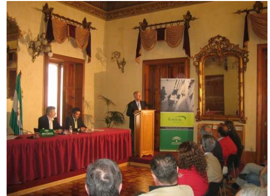
Las comarcas andaluzas recibirán 406 millones de euros.