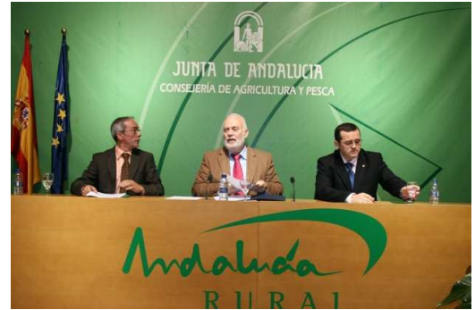
Presentación Regional del Proyecto NERA

tenemos que seguir trabajando para que aumente la dimensión de nuestras empresas, concentren más y mejor la oferta y se internacionalicen los mercados.