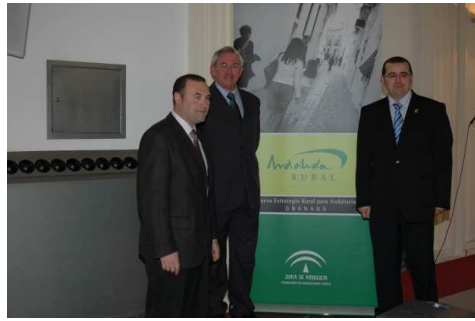
En la foto, la presentación de Nera en Granada

Se trata de un proyecto con el que la Junta pretende hacer fluir la información de