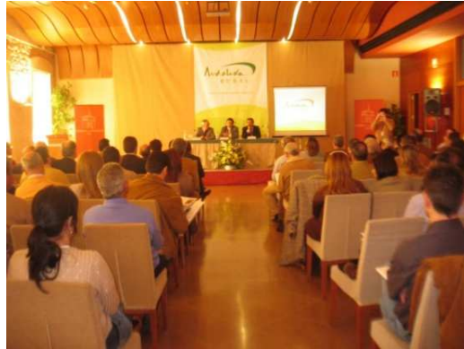
El Director General de Desarrollo Rural acudió al acto

Este proyecto pretende favorecer una reflexión profunda y participativa acerca del mundo rural y establecer las directrices para el desarrollo de los territorios rurales andaluces hasta el 2013