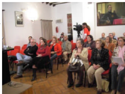
En la imagen, uno de los foros municipales organizados en la comarca de la Campiña Sur de Córdoba

televisión, que garantizan un voto anónimo y resultados instantáneos.