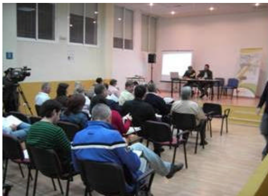
En la imagen, uno de los foros municipales celebrados el pasado mes de octubre en la comarca de la Sierra Morena Cordobesa

En esta fase del Proyecto NERA se ha dado a conocer a la población serrana los objetivos, líneas y actuaciones que regirán la futura estrategia de desarrollo comarcal