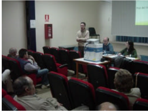
En la imagen, foro municipal organizado por el GDR del Guadajoz-Campiña Este en Castro del Río

El equipo humano que conforma el Grupo de Desarrollo Rural del territorio cordobés está convencido de que el amplio proceso de participación ciudadana suscitado con NERA, garantizará el éxito de la futura estrategia de desarrollo comarcal