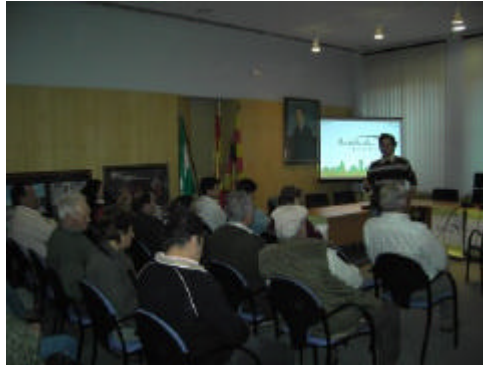
En la foto, foro municipal organizado por el Grupo de Desarrollo Rural de Los Pedroches

En estos encuentros se ha pretendido informar a la población de la comarca de los resultados que se están obteniendo del proceso de reflexión impulsado por el Proyecto NERA